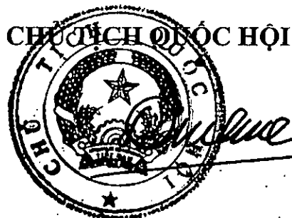
Vương Đình Huệ

Nghị quyết này được Quốc hội nước Cộng hòa xã hội chủ nghĩa Việt Nam khóa XV, kỳ họp bất thường lần thứ 5 thông qua ngày 18 tháng 01 năm 2024.